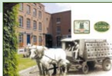
▲ À partir de 1950, la famille Friart poursuit la fabrication d'une large gamme de bières, parmi lesquelles la St-Feuillien et la Grisette .

BRASSERIE ST-FEULLIEN SA Rue d'Houdeng, 20 7070 LE ROEULX Tél : 064/67.37.68 - Fax : 064/67.67.30 Internet : www.st-feuillien.com E-mail : brasserie.st-feuillien@skynet.be