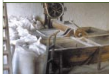
Début du processus : le malt, concassé, est mélangé à l'eau. Fin du processus : la St-Feuillien , en bouteilles, achève sa maturation pendant trois semaines dans une chambre chaude.