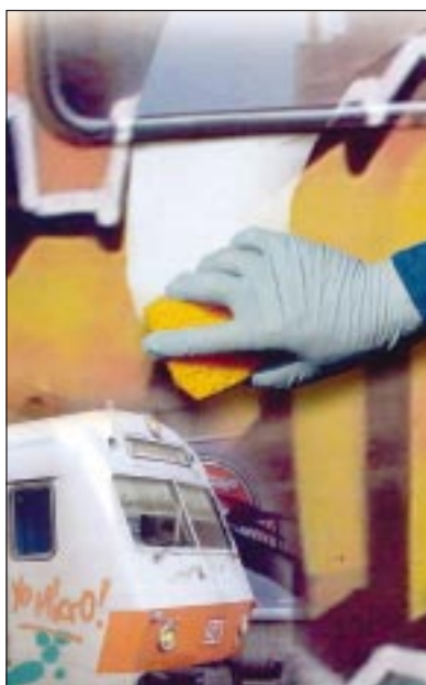
▲ Lodan propose des détergents anti-graffitis n'agressant pas les peintures et vernis...

Le succès de ces peintures est croissant; elles répondent, en effet, aux besoins d'une clientèle professionnelle exigeante, tant sur la qualité des produits que sur le service apporté !